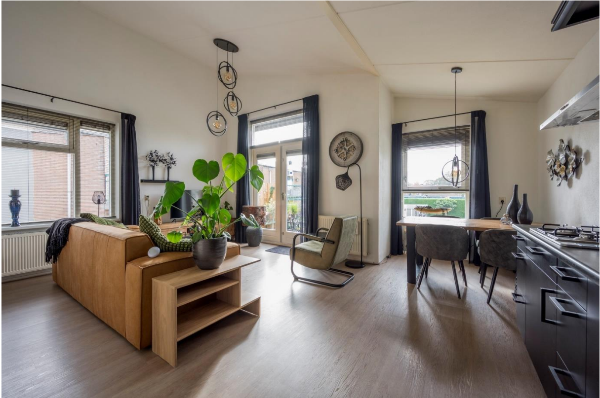
Woonkamer met openslaande deuren naar het balkon