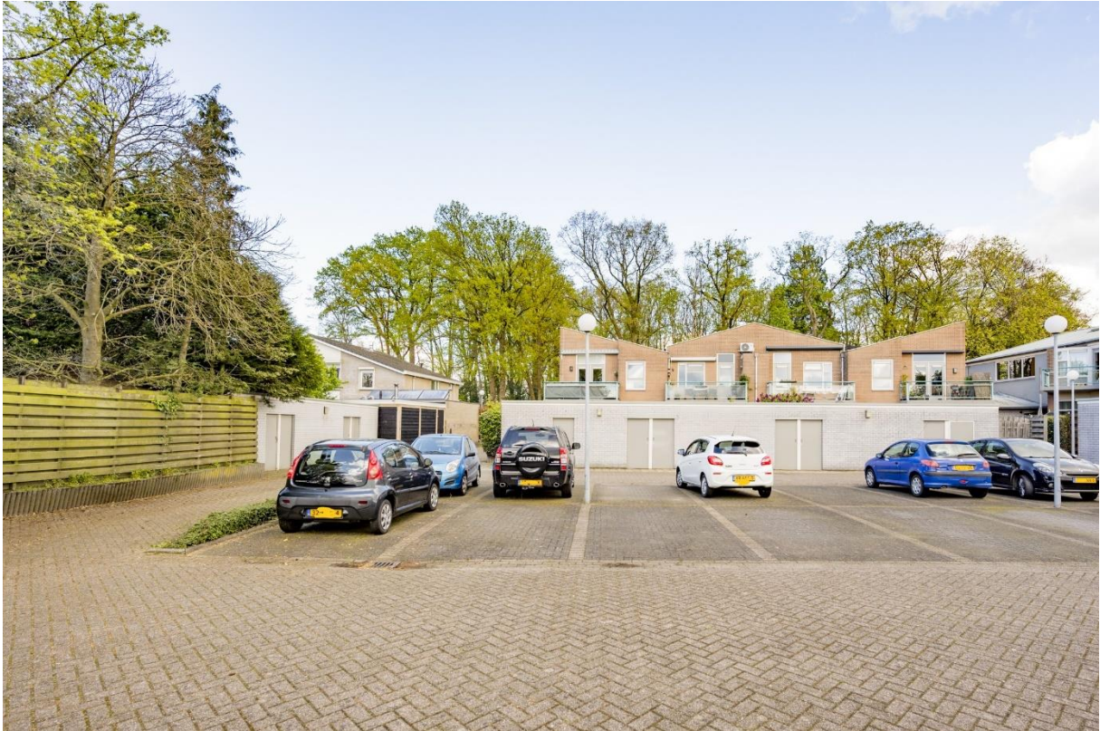
Parkeerplaats achter het appartementencomplex