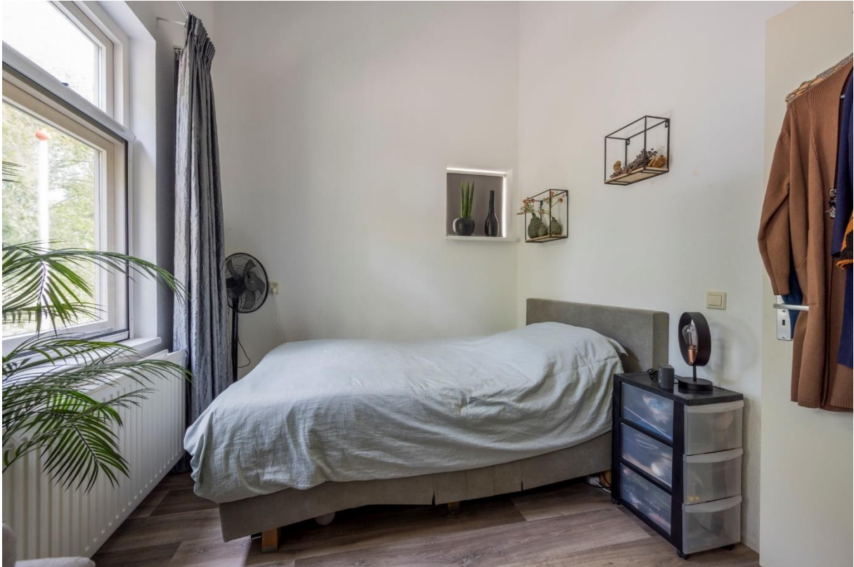
Slaapkamer gesitueerd aan de voorzijde